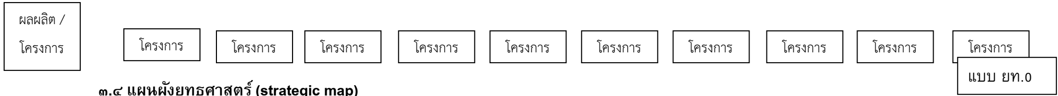
๓.๔ แผนผังยุทธศาสตร์ (strategic map)