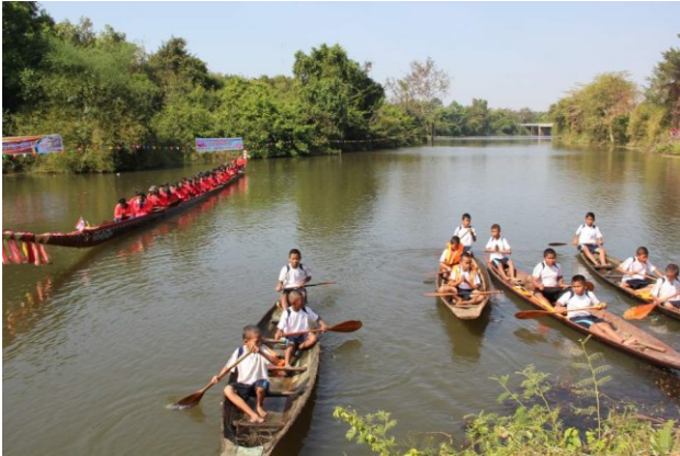
“ห้วยทับทัน”