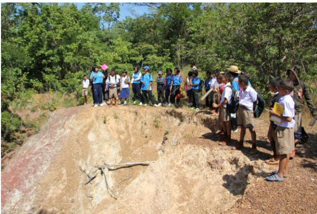
“ไม้กลายเป็นหิน”

“พะยูนจำ อย่าร้องไห้” ผืนป่าโนนใหญ่แห่งนี้มีพะยูนนับพันต้น เมื่อพะยูนกลายเป็นต้นไม้ที่มีราคา พะยูนในป่าโนนใหญ่ถูกกลุ่มมิจฉาชีพลักลอบตัดไปจำนวน ๓๗ ต้น เหลือให้เห็นเพียงตอเท่านั้นแต่ตอพะยูนต้นหนึ่งพยายามปรับตัวเอาชีวิตรอดโดยการแตกแขนงรอบ ๆ ต้นของตอเดิมแล้วค่อย ๆ เจริญเติบโตขึ้นเรื่อย ๆ ที่เป็นเช่นนี้เพราะรากใต้ดินสามารถหาน้ำและแร่ธาตุลำเลียงมาช่วยลำต้นต่อได้นั่นเอง พะยูนจัดเป็นไม้มงคลที่คนไทยจัดลำดับให้อยู่ในไม้มงคล ๙ ชนิด ได้แก่ ชัยพฤกษ์ ราชพฤกษ์ ทองหลวง ไม้สีสุกกันเกรา ทรงบาดาล สัก พะยูน และขนุน เชื่อว่าใครได้ปลูกไว้ประจำบ้าน จะทำให้บุคคลในบ้านมีแต่ความสุขความเจริญในชีวิต ปัจจุบันพะยูนมีเหลือเฉพาะภาคอีสานเท่านั้น