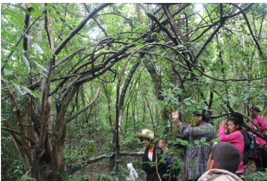
ชาวบ้านตำบลอีเซ อำเภอโพธิ์ศรีสุวรรณ จังหวัด

ศรีสะเกษ ได้อาศัยและใช้ประโยชน์จากป่าชุมชนโนนใหญ่เป็นแหล่งอาหารตามธรรมชาติ เก็บหาสมุนไพรเพื่อรักษาโรค ใช้เศษไม้จากป่าเพื่อเป็นเชื้อเพลิงในการหุงต้ม หรือใช้ป่าเป็นที่เลี้ยงสัตว์ คนที่นี่มีวิถีชีวิตที่ผูกพันกับผืนป่าแห่งนี้มาอย่างยาวนาน ลักษณะของป่าชุมชนโนนใหญ่เป็นป่าผสมประกอบด้วยป่าดิบแล้ง ป่าเบญจพรรณ ป่าเต็งรัง และป่าเบญจพุ่มพรรณก็จะมีหลากหลายตามสภาพ ในป่าดิบแล้งและป่าเบญจพรรณ มีต้นไม้หลัก ได้แก่ ต้นยางนา นาบากระบอก ตะแบก พันชาติ มะค่า ในป่าเต็งรังซึ่งเป็นป่าในเขตที่มีหน้าดินตื้น ดินชั้นล่างเป็นหินลูกรัง ไม้สำคัญได้แก่ ไม้เต็งไม้รัง ในเขตที่เป็นป่าเบญจพุ่ม พืชหลักจะเป็นไม้หว้า ไม้สะแก เสียว