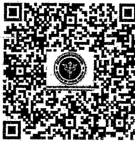
ประกาศโฆษณา

รายละเอียดตาม Qr code ที่แนบมาพร้อมนี้ เพื่อปิดประกาศให้ทราบโดยทั่วกัน ณ ที่ตั้งของสำนักงานของท่าน จะเป็นพระคุณ